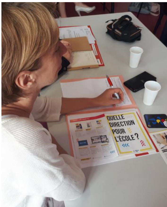
Dans les situations de conflit notamment avec des parents, la direction se sent souvent peu soutenue par sa hiérarchie.