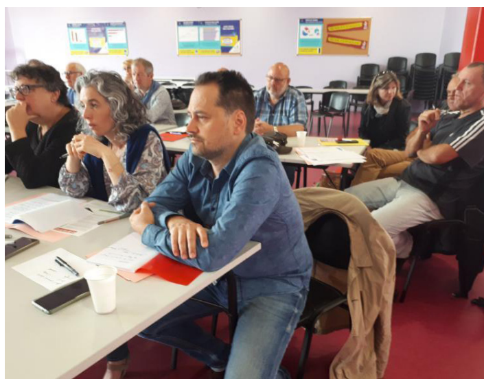
Le métier s'est complexifié et judiciarisé, une formation à la hauteur devrait être dispensée.